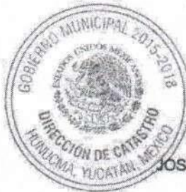
LORENA ISABEL CHAN CHUC