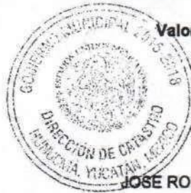
LORENA ISABEL CHAN CHUC